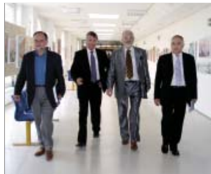
Snímek zachycuje prof. Zemlu z onkologického centra v Polsku (na snímku druhý zprava) a generálního konzula ČR v Polsku (vpravo)...

Hosté si prohlédli vstupní část objektu naší nemocnice, pracoviště urgentního příjmu a zaví-