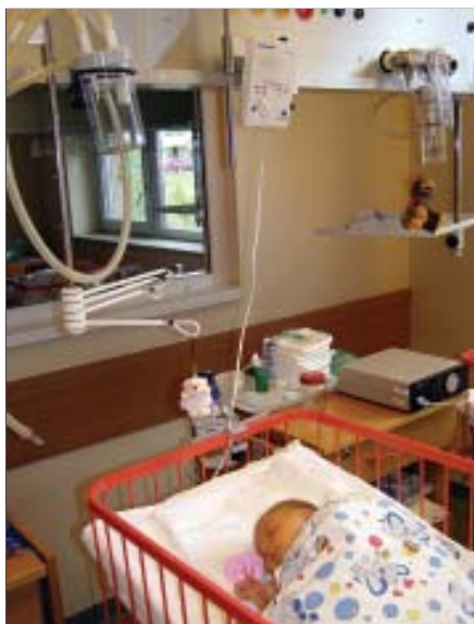
Denně monitorujeme přístrojem BabySense II až 50 novorozenců...

„Pomoc Nadace Křižovatka je pro nás velmi přínosná a rádi ji vítáme,“ konstatovala primářka Podešvová. „Životnost přístrojů totiž není neomezená, záruka na ně jsou dva roky,