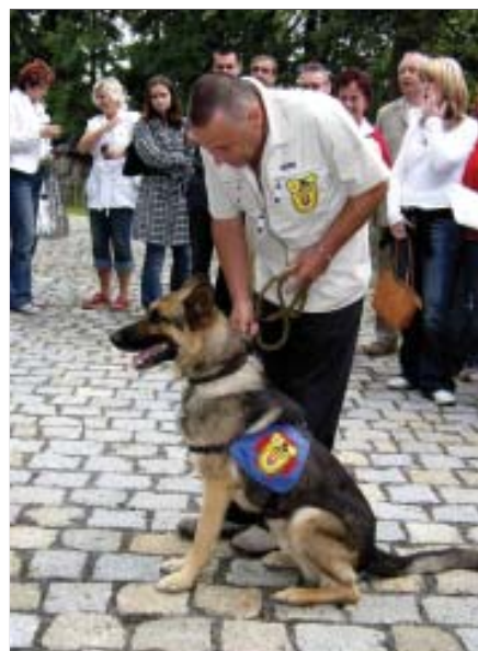
Se cvičenými psy přijela na sympodium Speciální kynologická záchranná služba Slovenska z Bratislavy...

Symposium mělo u účastníků pozitivní odezvu, pochvalovali si otevřenost jednání. Jsem přesvědčen, že vše je v lidech, v jejich znalostech a schopnostech a ve vzájemném respektování jednotlivých odborných složek. Na sympoziu jsme navázali osobní vztahy, vyjasnili jsme si, co koho trápí a našli jsme i způsoby, jak vzájemnou komunikaci zjednodušit. Mohu hned uvést i jeden konkrétní případ z praxe. Když druhý den ráno nastoupil docent Pleva na službu, přivezli mu pacienta, který byl pobodán a nůž měl zabodnut v hrud-