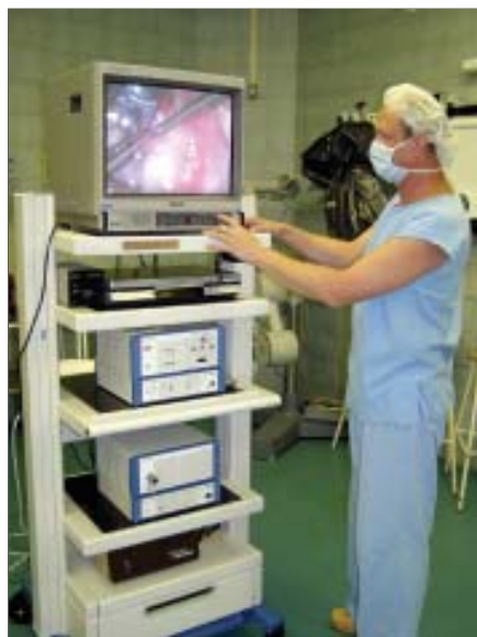
Věcný dar manželů Filsákových posloužil k dovybavení záznamové techniky.

Neurochirurgická klinika děkuje manželům Filsákovým (fa VINAMET s.r.o., Haviřov) za poskytnutí věcného daru, který posloužil