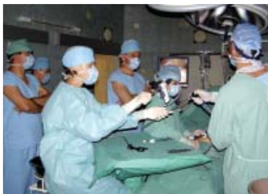
V rámci kurzu byly provedeny čtyři operační výkony...

podstatně méně rozvinutá. V našem zdravotnictví je mnohem horší situace, pokud jde o platby za zdravotnické výkony. A určitě pokud jde o úhrady plateb za chirurgické výkony v oblasti laparoskopie. Víím, že se nemůžeme srovnávat například se Švýcarskem nebo s USA, ale v budoucnu bychom chtěli laparoskopii pozvednout alespoň na úroveň našich nejbližších sousedů. Určitě se k vám přijedeme ještě podívat.“