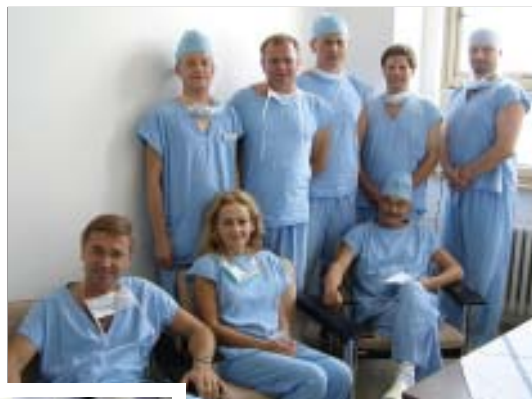
Polští kolegové s přednostou naší Chirurgické kliniky – na snímku vpravo dole.

českém chirurgickém pracovišti zabývajícím se laparoskopií. Byli jsme mile přijati, je zde velmi příjemná atmosféra. Z medicínského pohledu nás zaujala vynikající operativní technika pana docenta, výborná organizace práce na pracovišti, dokonalá spolupráce s asistenty, sestrami – instrumentářkami, klid při operaci. Laparoskopická chirurgie v Polsku je