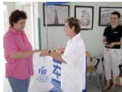
Každý z dárců obdržel po odběru malou pozornost.