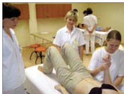
Součástí státní zkoušky byla praktická část, která probíhala na klinických pracovištích naší fakultní nemocnice...