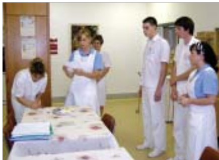
V průběhu maturitního týdne pracovali studenti v několika skupinách...

V posledním květnovém týdnu probíhaly praktické zkoušky na pracovišti Urologického oddělení a stanici C Interní kliniky. V letošním roce byly praktické maturity studentů v určitém slova smyslu výjimečné, maturoval totiž poslední ročník všeobecných sester, které absolvovaly kvalifikační přípravu na SZŠ. V příštích letech bude jejich příprava probíhat pouze na VZŠ či bakalářském studiu na VŠ.